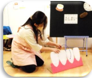
歯間ブラシの使い方