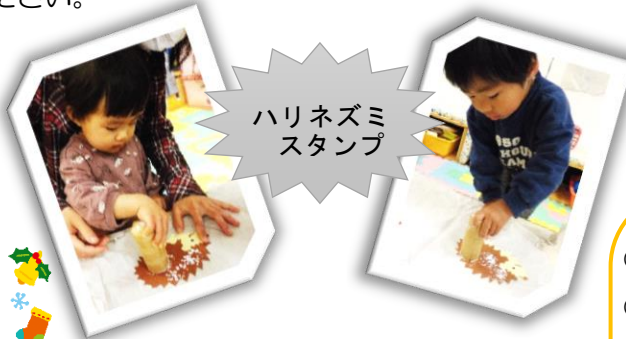
ハリネズミスタンプ